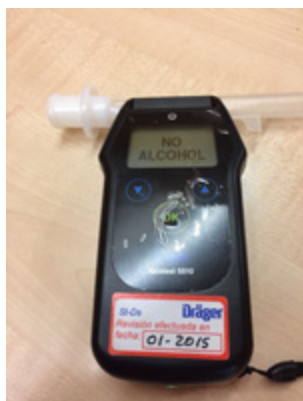
Tabla de seguimiento de consumo de alcohol a partir del alcoholímetro